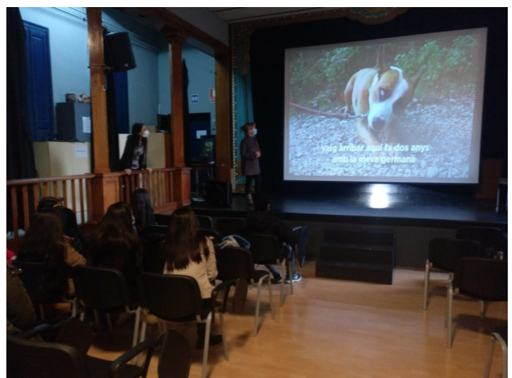
Taller a l'institut Vall d'Hebron